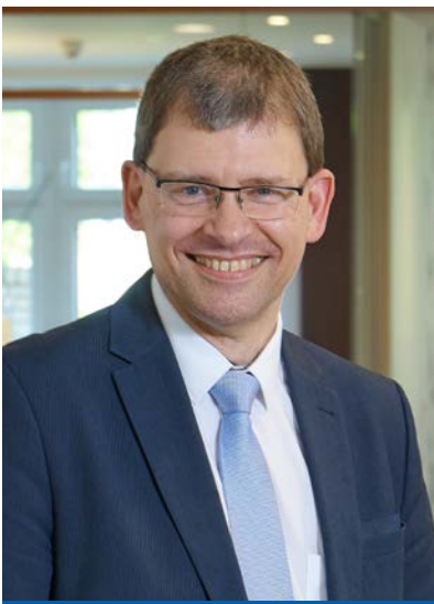
THORSTEN LEMCKE Immobilienvermittlung

☎ 0151 46 732 685 ✉ andrea.huth@vr-wk.de 🌐 immo.vrbank-westkueste.de